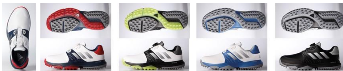
Q44783 ホワイト/スカーレット/ ダークスレート 29.0cm/30.0cmサイズ 対応

ミッドソールに「bounce フォーム」を搭載し、高いクッションングと適度な反発を繰り返すことで歩行をサポートする軽量スパイクレスシューズ。「adiwear ラバースパイクレスソール」がショット時にも高いパフォーマンスを発揮するほか、スウェー防止に効果的な「Energy Sling」を搭載し、さらに高いグリップ力と耐久性を保持します。最新の「Boa LP-6 Dial」搭載。