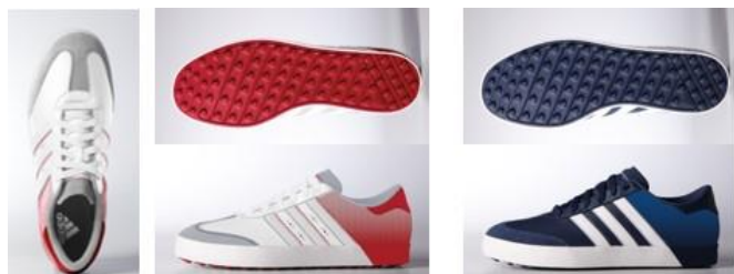
Q44748 ホワイト/赤ホワイト/ スカーレット

クラシックなアディダスのストリートシューズを現代風にアレンジし、個性的な足元を演出するカラーブロックデザインを採用したスパイクレスシューズです。高い柔軟性と耐久性を兼ね備えた「adiwear ラバースパイクレスソール」に加え、前足部には天然皮革を使用し、履きこむほどに足になじんでいきます。