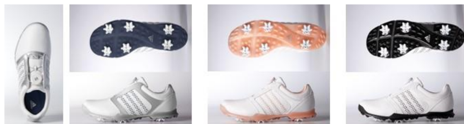
Q44700 クリスタルホワイト/ ミステリーブルー/ シルバーメタリック

ウィメンズ用に新たに開発されたラストは、これまでのウィメンズモデルの中で最も幅が広く、内足部の可動領域を拡大しました。一方で、レングス(縦)は通常よりも短くし、甲部分を低く滑らかにすることでフィット感をアップ。加えて、新開発の「Fitfoam pillow インソール」採用でカスタムフィットのようなフィット感、かかと部分のクッションングを実現。また、前足部分に使用された薄い高品質な天然皮革が履きこむほどに足へなじんでいきます。