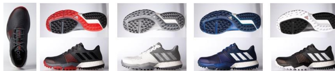
Q44778 オニキス/コアブラック/ スカーレット