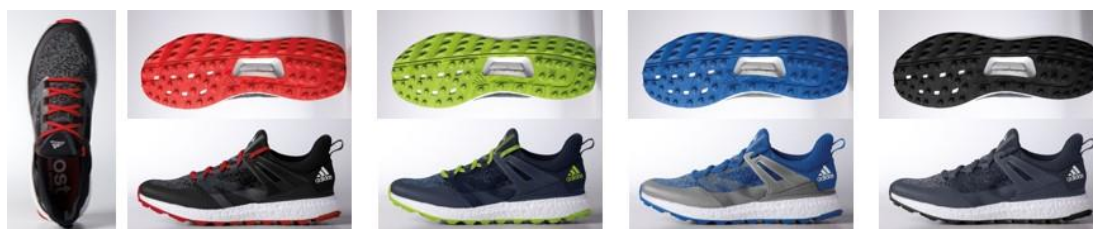
Q44684 コアブラック/オニキス/ スカーレット