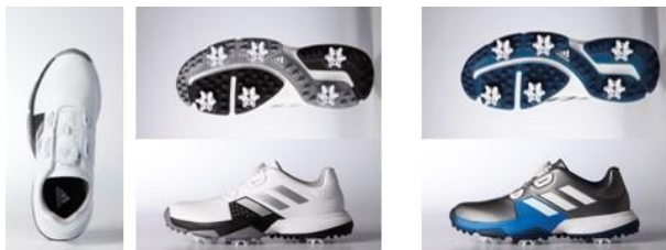
F33535 ホワイト/シルバーメタリック/ コアブラック

ジュニア向けゴルフシューズで初の Boa 搭載モデル。前足部はやや幅広のゆったり設計ながらヒール部のフィット感を高めたラストを採用しています。また、ミッドソールに「bounce フォーム」を採用し、ソフトなクッションングを実現。歩行を促進し、快適なラウンドをサポートします。