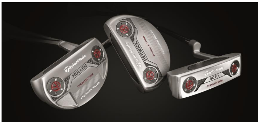
『TPコレクション』シリーズ (SOTO / MULLEN / BERWICK) 2017年4月上旬より順次販売開始

テーラーメイドゴルフ株式会社(本社:東京都江東区/代表取締役社長:マーク・シェルドン・アレン)ではこの度、さらなる高級感を演出する新たな削り出し工法を用いるとともに、新開発の"ピュアロール™"インサートを採用し、これまでにない直進性とソフトな打感、機能美を融合させた『TPコレクション』シリーズを発売します。