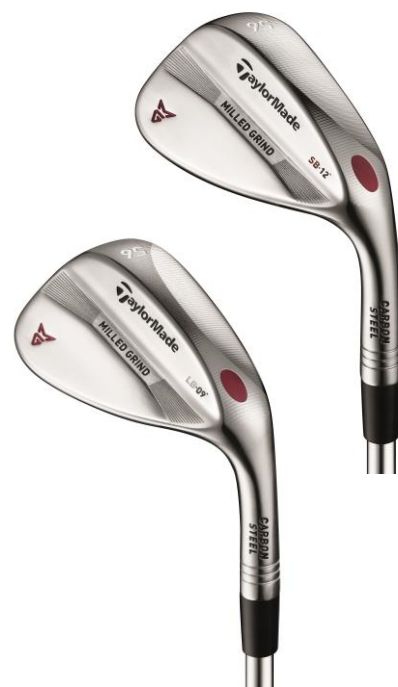
『MILLED GRIND WEDGE (SB、LB)』 2017年4月上旬より順次販売開始

また、ホーゼル内のシャフトの入る深さをこれまでの1インチから1.5インチと深くし、ヒール部分にポリマー製の赤い『プレジジョン・ウェイト・ポート』を埋め込むことで、シャフトとの結合が高まると共に、クラブ中央に重心を移動させることに成功し、これまで以上の高い操作性と寛容性を実現。フェース面では、溝と溝の間隔を狭めることで、溝の数を一本追加し、溝の角度を38%上げる事で打ち出し角を抑えつつ、スピン量を増大させる効果を発揮。これまで以上に高性能、高精度で、バランスの取れた打感のよいウェッジです。