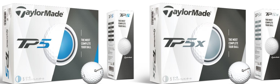
『TP5 ボール』 / 『TP5x ボール』 (2017年4月上旬より順次販売開始)

テーラーメイドゴルフ株式会社(本社:東京都江東区/代表取締役社長:マーク・シェルドン・アレン)ではこの度、圧倒的な飛距離性能を持つ5層ツアーボールの新シリーズ、『TP5 (ティーピーファイブ) ボール』、『TP5x (ティーピーファイブエックス)ボール』を2017年4月上旬より順次販売します。