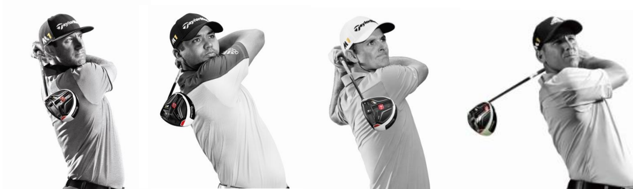
『TOUR PREFERRED X BALL』使用中の4選手 (ダスティン・ジョンソン、ジェイソン・デイ、 ジャスティン・ローズ、セルジオ・ガルシア)

ワールドランキングでも、上位13人中4名が使用(1月14日現在)、さらに2015年のUSPGAツアーにおいては、モデル別で2位 *1 と高い使用率を誇る5ピース構造の『TOUR PREFERRED X ボール』と、4ピース構造の『TOUR PREFERRED ボール』をさらに進化させ、プロの要望に応え改良しました。