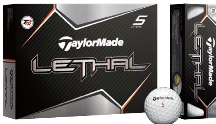
『LETHAL ボール』 2013年2月発売予定

テーラーメイドゴルフ株式会社(本社:東京都江東区/代表取締役社長:菱沼信夫)ではこの度、新たなディンプルパターンを採用し、世界のツアープロが認めた5層構造のツアーパフォーマンスウレタンボール『LETHAL』(リーサル)を、2013年2月より発売開始します。