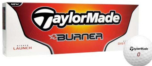
ミスヒット時の飛距離を軽減する2ピースボール