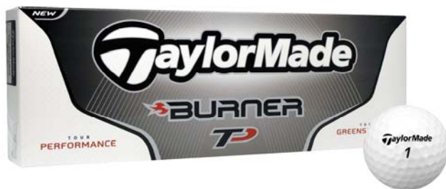
飛距離とツアーフィーリングの3ピースボール

『BURNER TP ボール』およびNew『BURNER ボール』ともに、空気抵抗を抑制するテーラーメイド独自のディンプルデザイン、「ハイ・リフト・ディンプル・パターン」を採用。揚力を高め飛行力を維持することでオフセンターヒット時におけるロスを軽減、大きな飛距離を可能にします。