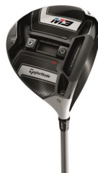
『M3 440 ドライバー』