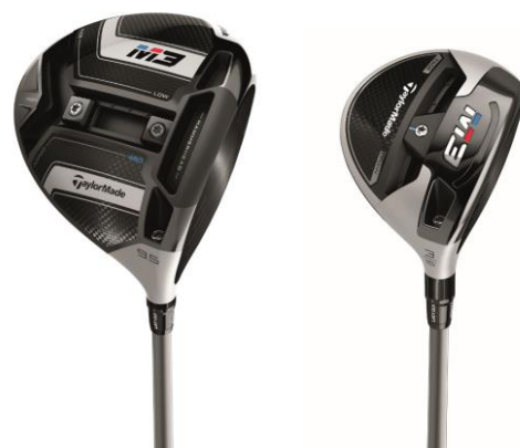
『M3 460 ドライバー』 『M3 フェアウェイウッド』