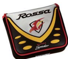
Men's モデル用ヘッドカバー