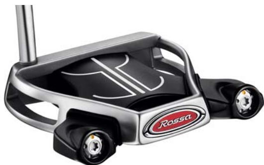
『ROSSA® MONZA SPIDER AGSI™+』