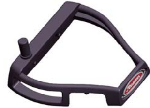
スチール製ワイヤーフレーム

スチール製のワイヤーフレーム構造を採用することによって、ヘッド重量をヘッドの外周縁により多く配分する事が可能となり、ミスヒット時にもその際に生じるねじれやヘッドのブレを抑制し、安定したパッティングを可能にします。