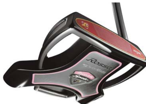
『ROSSA® MONZA SPIDER AGSI™+』