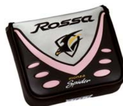
Women's モデル用ヘッドカバー